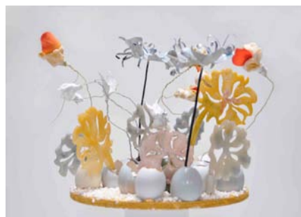
primizia lunare, 2011, assemblaggio, cm.32 x 32 xh. 29