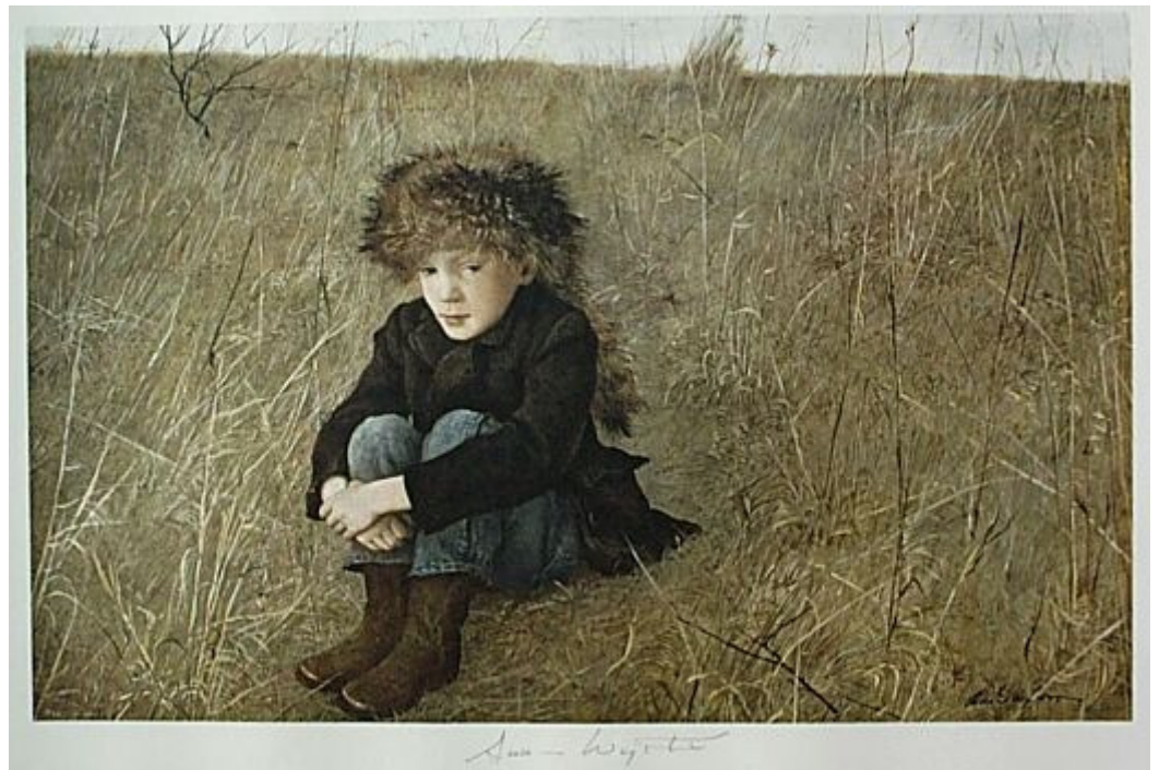
Andrew Wyeth - "Faraway" 1952

Camminò a lungo attraverso i campi gialli con le lacrime che gli scorrevano dentro, ma solo dentro. Poi si sedette tra l'erba alta abbracciando le ginocchia, e molti pensieri passarono da quelle parti. Progettò di diventare grande e di partire. Sarebbe andato lontano, sarebbe andato dall'altra parte del mare.